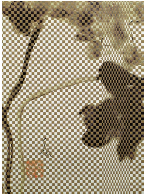
Photophysique Tissage Photogramme